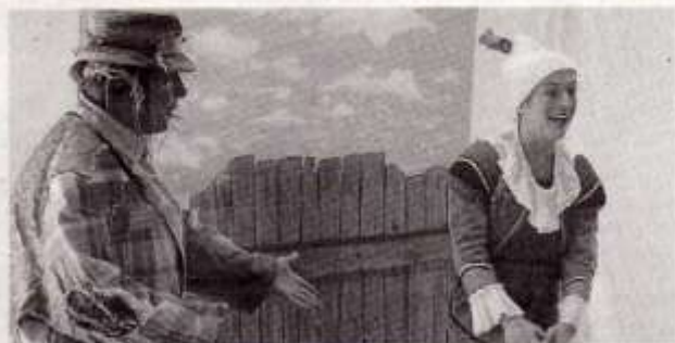
Un et Deux sont des clowns en recherche d'amitié. Ils sont différents mais ils finissent par devenir de bons copains.

Caravane compagnie a présenté son nouveau spectacle